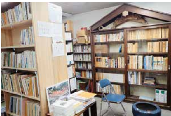
▲自治資料室に並ぶ資料の数々

八王子自治研究センターが開室している「自治資料室」では、地方自治や地域文化に関する資料を収集、公開しています。こうした資料は地方行政にとどまらず、市民活動にも新たな活力を生み出していくことができるはずです。八王子に関する資料も豊富に所蔵しています。ご利用を希望される方は、下記までお問い合わせください。